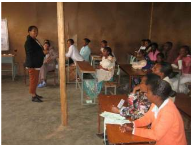
Naar de lessen in omgangsvormen en voorlichting over hygiëne en hiv/aids wordt ademloos geluisterd.

Allereerst worden de deelnemers geholpen met eerste levensbehoeften zoals voedsel, kleding, toiletartikelen en medische zorg. Voor degenen die geen onderdak hebben, wordt een onderkomen gezocht en de huur en de basisinrichting daarvan wordt betaald. Een belangrijk onderdeel van de hulp is het zogenaamde resocialisatieprogramma. Dat betekent dat de deelnemers vertrouwd worden gemaakt met "normale" omgangsvormen. Vooral degenen die al langer op straat bedelen, weten nauwelijks hoe je met elkaar omgaat. Want als bedelaar word je òf volslagen genegeerd, òf je wordt letterlijk als straatvuil behandeld.