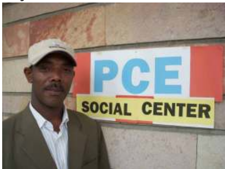
Abara, onze sociaal werker

De wijk waar ons social centre is, is één van de armste wijken van Addis Ababa en bedelaars zijn er legio.