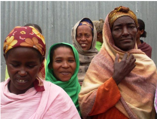
Een paar deelnemers aan ons project

U kunt ons voor bijeenkomsten uitnodigen voor een boeiende presentatie , waarbij wij vertellen en beelden laten zien over Ethiopië en wat "Food For All" daar doet. Gecombineerd met ons "winkelkje" en evt. Ethiopische hapjes wordt de bijeenkomst zeer zeker de moeite waard! Voor info of een afspraak kunt u contact opnemen met ons secretariaat.