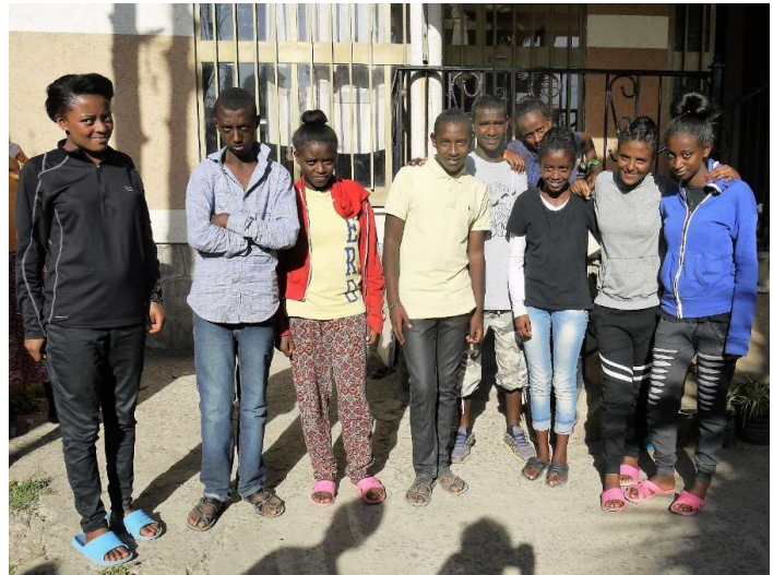
2017 – de kids, inmiddels een stel prachtige tieners