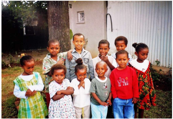
2005 – de kids toen zij net in Rehoboth woonden

In de nieuwsbrief van december kon u lezen dat het kinderkuis verhuisd was naar een prachtig ander, veel groter huis. We zijn een half jaar verder en gemeld kan worden dat zij wéér verhuisd zijn. De huur van het pand waar zij naartoe waren gegaan was zo schrikbarend hoog, dat er wel móest worden uitgekeken naar een kleiner onderkomen. Dat is gevonden en in mei zijn de kids verhuisd. Het huis is wel kleiner, maar het ligt dichtbij hun school, dus dat is een groot voordeel. De kids hebben het er prima naar hun zin en dat is belangrijk!