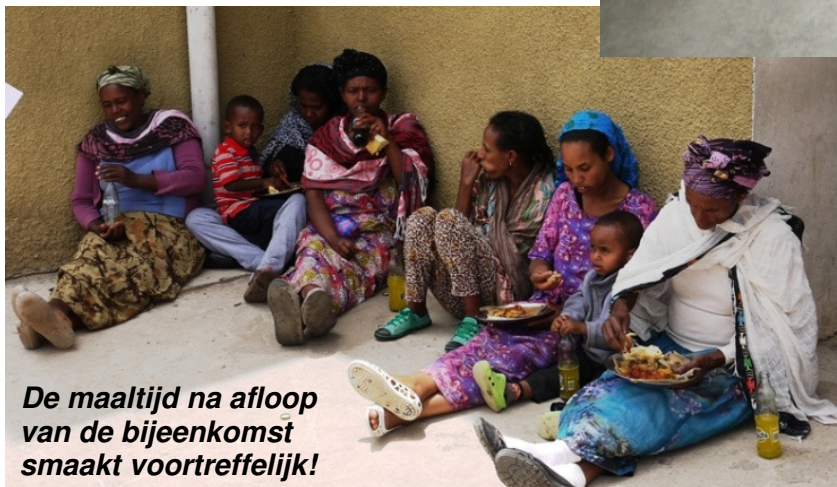
De maaltijd na afloop van de bijeenkomst smaakt voortreffelijk!

“Deel je brood met wie honger lijdt.” Jesaja 58:7