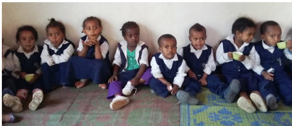
De kinderen van de school hebben even pauze.

Intussen kan het project doorgaan en het gaat heel goed. Men wacht op dit moment op toestemming om de school in september a.s. uit te breiden met "grade 1". Het is spannend of zij die toestemming op tijd krijgen.