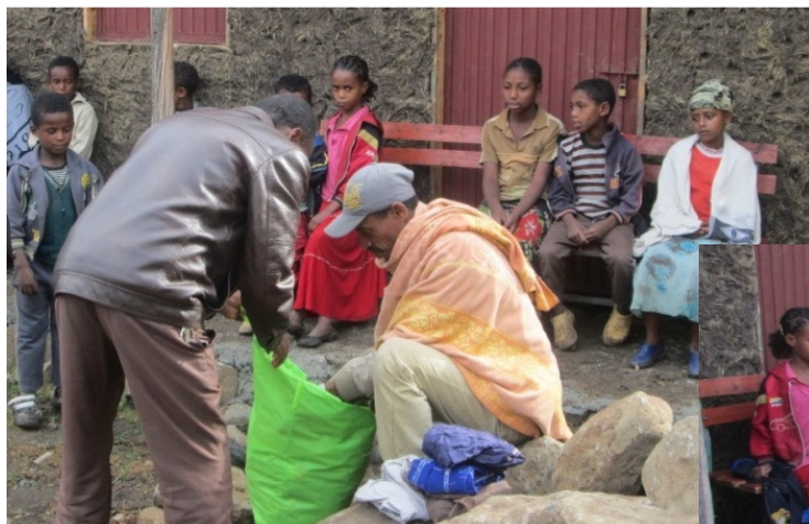
De kleding wordt zorgvuldig uitgezocht en verdeeld

aan ieder die dit voorjaar gehoor heeft gegeven aan onze vraag om gebruikte kinderkleding. Die kleding hebben we meegenomen naar Ethiopië en geloof maar dat men er ginds heel blij mee was! Niet alleen in ons project, maar ook de kinderen in Fital, waar de kleding voor grotere kinderen naartoe ging.