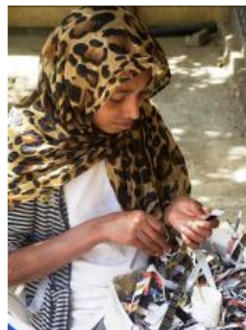
Medihanete heeft zichtbaar plezier in haar werk!