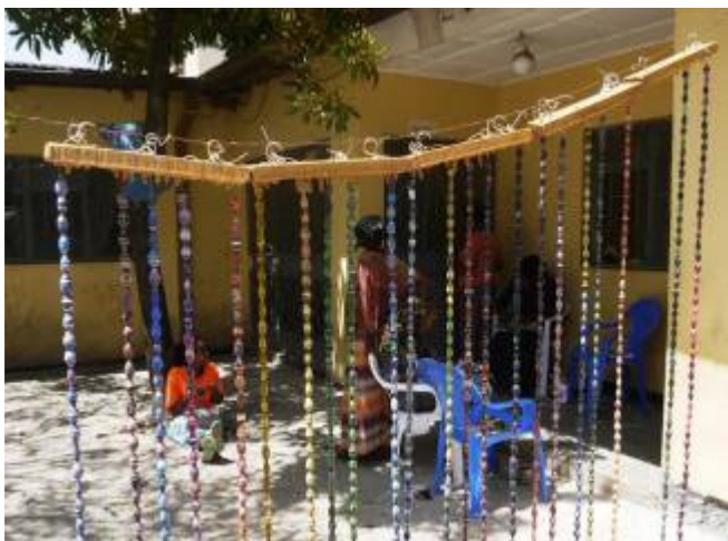
De gemaakte kralen hangen te drogen in de zon.

Afgelopen november zijn we dus op bezoek geweest in Addis. Behalve besprekingen met de directie en de leiding van EHE hebben we uitgebreid kunnen rondkijken bij de dagopvang voor de baby's en peuters, op de school die de grotere kinderen bezoeken en bij het atelier waar vrouwen sieraden maken.