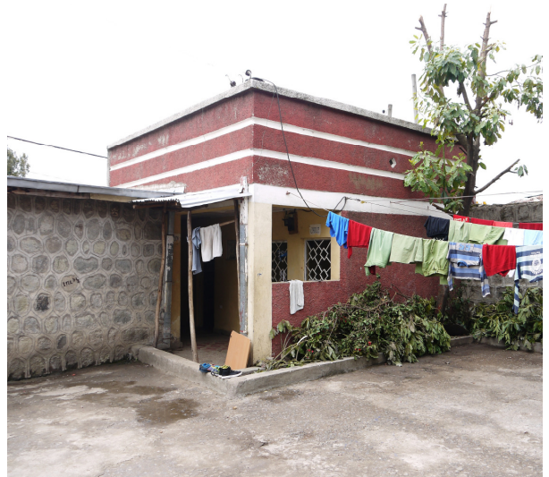
Het gedeelte van het huis waar de jongensslaapkamer is.

Weet u..... dat het de moeite waard is om een kijkje op onze website te nemen?! www.food-for-all.org