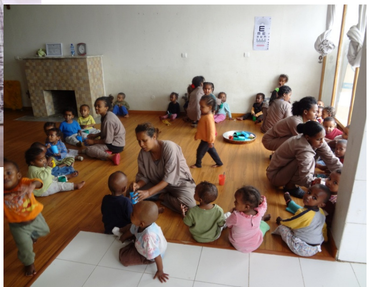
Als de kinderen wakker zijn, hebben de verzorgsters het heel wat drukker!

Ook voor de kleuters is er tijd ingepland voor een middagdutje.