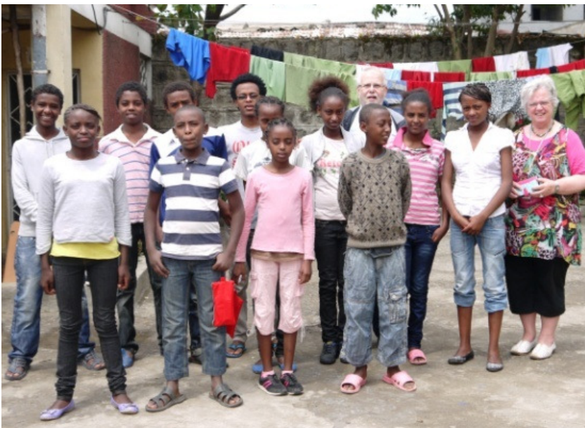
Op bezoek bij een prachtig stel tieners!