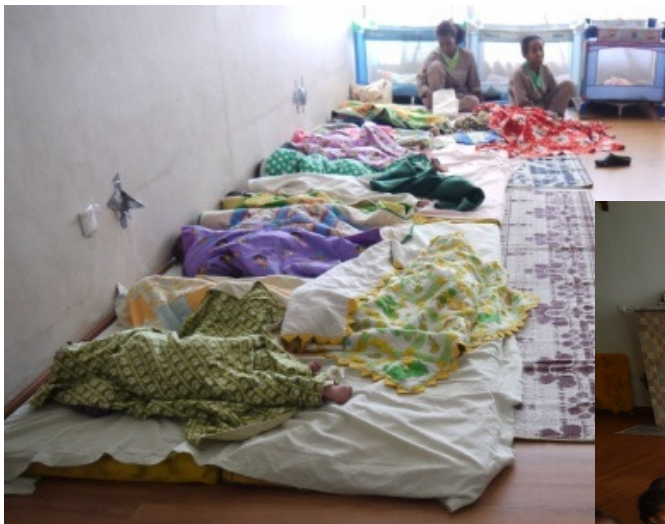
De peuters van de dagopvang doen een middagslaapje onder het toezien oog van de verzorgsters.