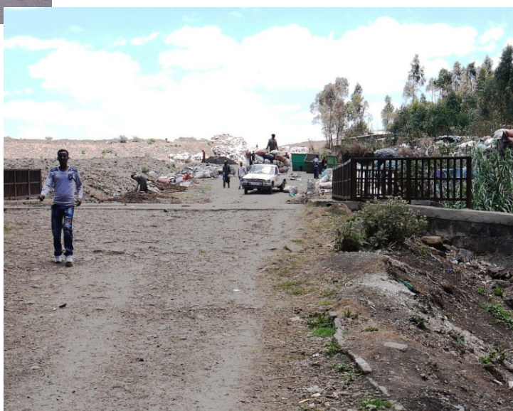
De wijk Kore, gelegen naast een enorme vuilnisbelt

In de wijk Kore, een straatarme wijk in het zuid westen van de stad, biedt Embracing Hope Ethiopia (EHE) hulp aan zo'n 180 gezinseenheden. Het gaat vooral om alleenstaande moeders met één of meer kleine kinderen. Zij krijgen de hulp die zij nodig hebben op diverse gebieden: gezondheidszorg, kinderopvang, opleiding, hulp bij het zoeken naar werk, alfabetiseringscursussen, onderdak enz. EHE is net als FFA een christelijke organisatie, wat echter niet uitsluit dat zij vrouwen van elke religieuze achtergrond in het project opneemt.