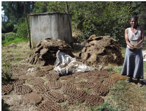
De plaggen, gemaakt van de “afvalstoffen” van de koeien, liggen te drogen om later verkocht te worden als brandstof.